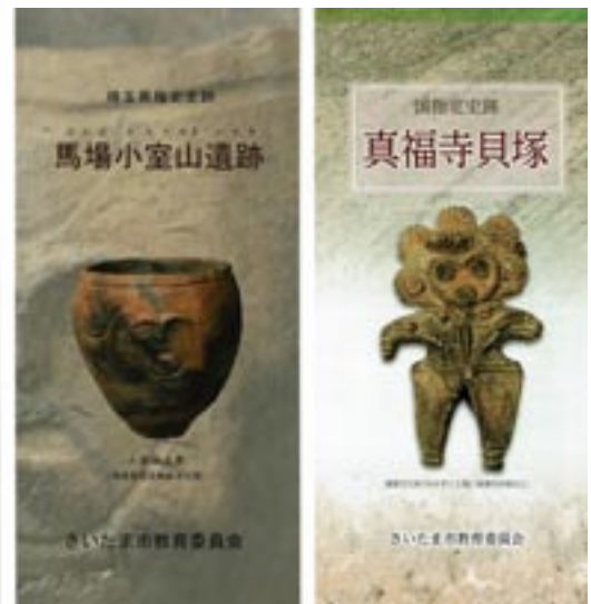
さいたま市教育委員会作成